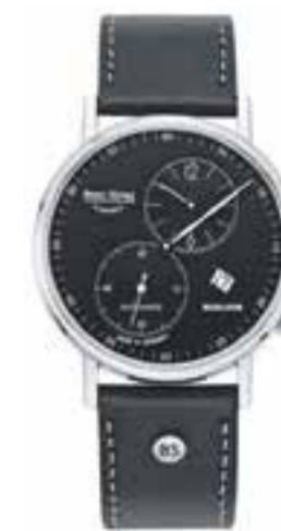
BRUNO SÖHNLE UHRENATELIER GLASHÜTTELE

Jederzeit entscheiden Form und Format über die Euphorie des Moments, den wir mit der Serie Rondo würdigen. Alles ist gut erkennbar und der Stil ist kein Akt der Balance, sondern ein Akt für die Balance exklusiver innerer Werte und dem Genuss prägnanter Klarheit. Der Bruno Söhnle RONDO REGULATOR .